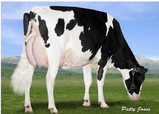
EDG RUBY UNO RIZA FOURTH DAM