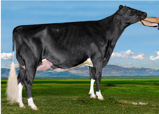
WESTCOAST MONTANA RIZA 4700 GRANDDAM