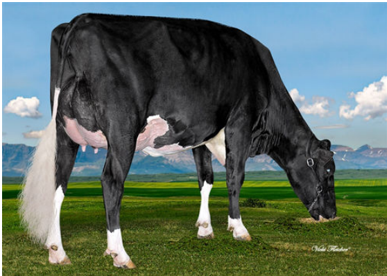
WESTCOAST MONTANA RIZA 4700 GRANDDAM